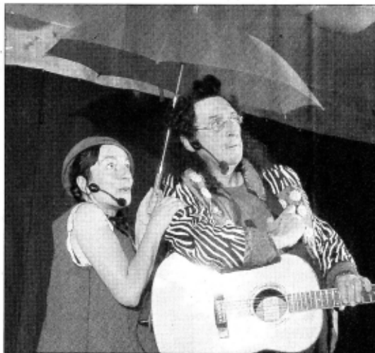
Tartine et Bretelle ont conté leurs aventures en chansons au jeune public.

Pour la troisième année consécutive, la Ruche à gîter a organisé un week-end de fête dans la petite station de la Ruchère-en-Chartreuse, afin de se retrouver après la saison de ski de fond et découvrir la beauté de ce site en été.