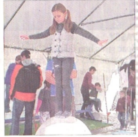
La compagnie La Gueudaine a attiré 130 spectateurs. Un atelier du cirque a suivi le spectacle.