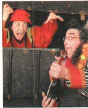
Les acteurs de "Rouge et Zèbre" ont emmené grands et petits dans un univers de musiques et chansons pour fêter Noël.

La salle polyvalente intercommunale à Bourgneuf s'est prêtée, dimanche, à un spectacle de Noël. À l'invitation de la communauté de communes du Gelon Coisin, la compagnie La Gueudaine interprétait "Rouge Zèbre". Le rendez-vous tout public aimantait près de 350 personnes. Avant de partager le goûter offert au final par les dix communes du canton chamoyard, préparé et servi par les jeunes du canton, en lien avec l'Espace cantonal jeunesse, les spectateurs appréciaient "Rouge" et "Zèbre". La petite dame espiègle et le grand costaud trouillard racontaient plus d'une heure durant un univers historié où chansons